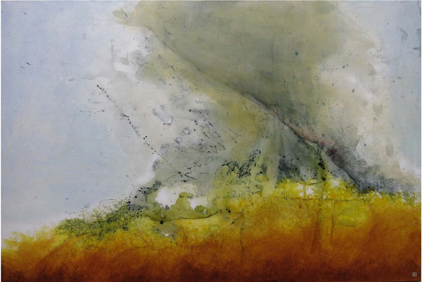
Sans titre Acrylique sur toile ©Jean Chauvin