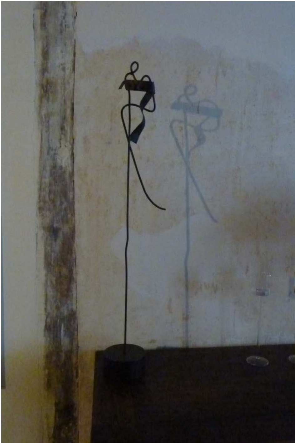
Sans titre