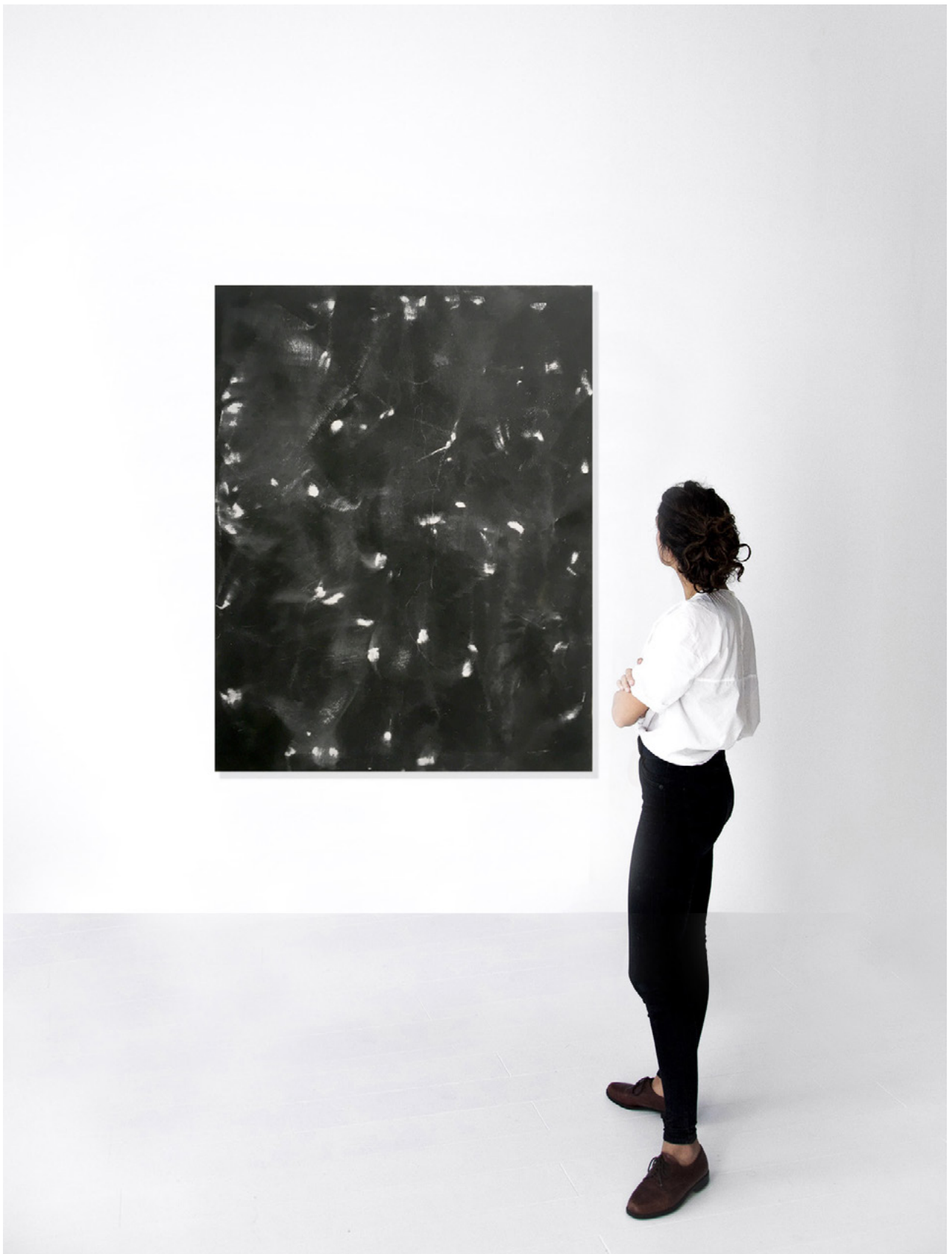
Images du mouvement sans titre, 2020 Points de contacts sur papier de verre, 150 x 110 cm Vue d'exposition Atelier Coreau © Alexandre Clanis