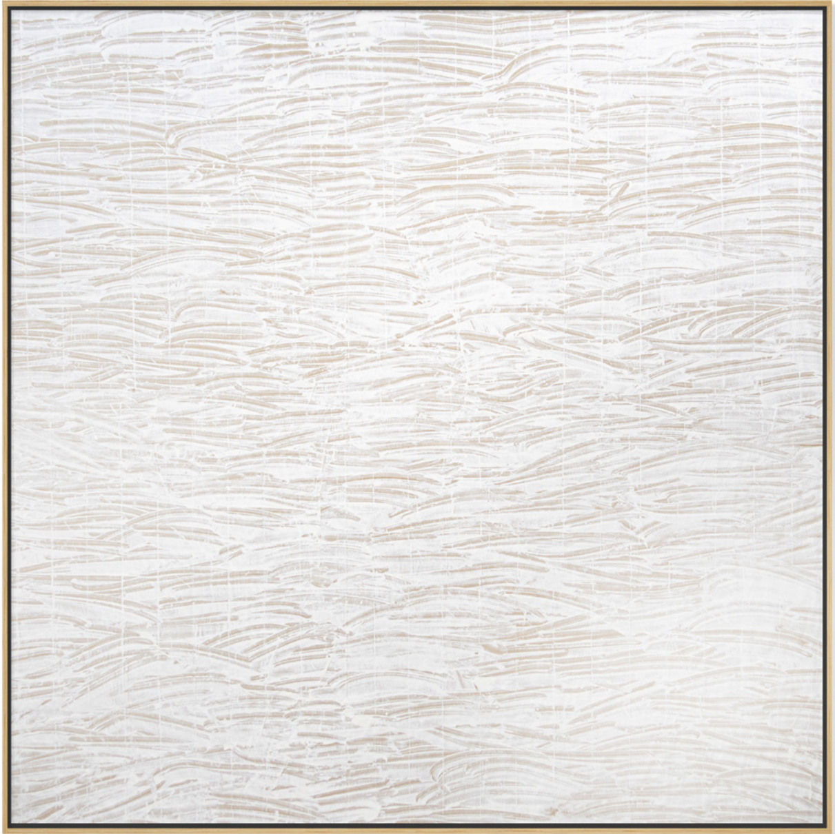
Empreinte , sans titre, 2022 Acrylique sur papier kraft, 200 x 200 cm © Alexandre Clanis