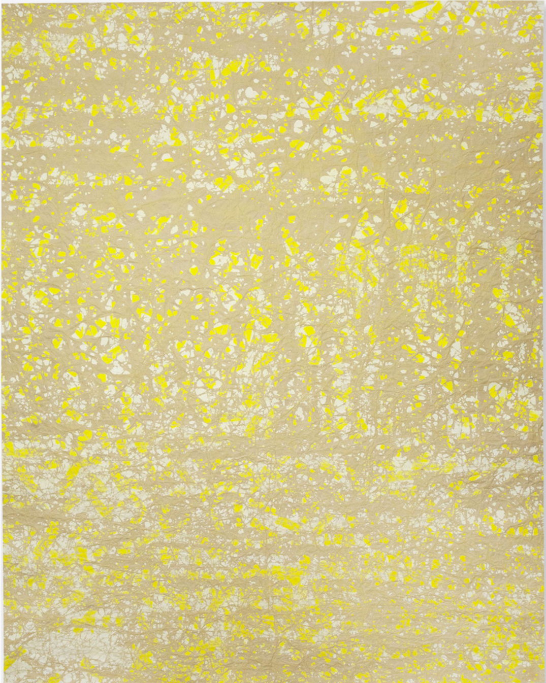
Peindre par soustraction sans titre, 2018 à 2021 Acrylique et encre sur papier kraft, 105 x 70 cm © Alexandre Clanis